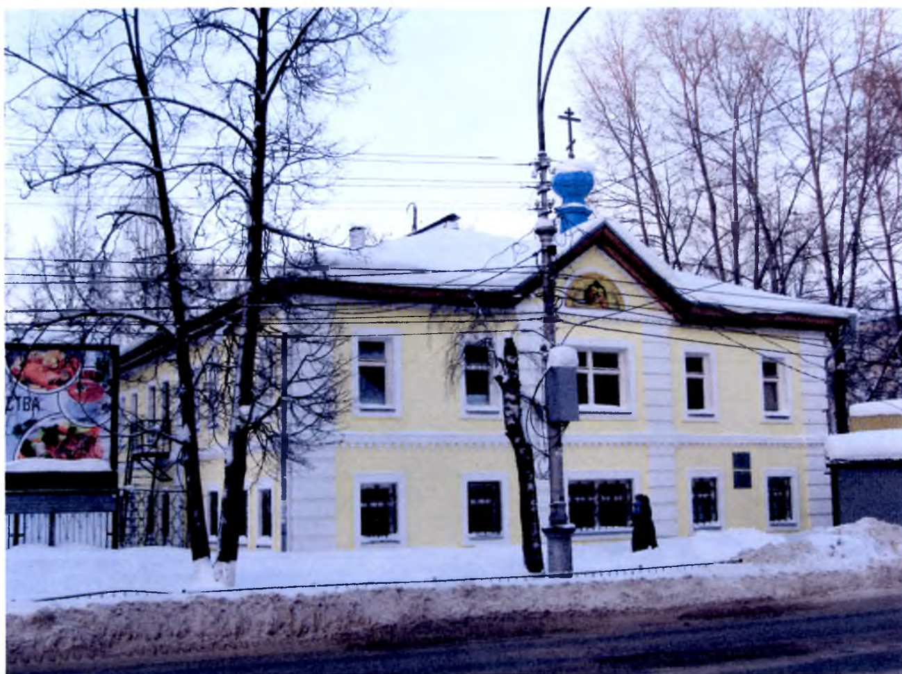
Фото 1. Общий вид памятника с улицы Бабушкина